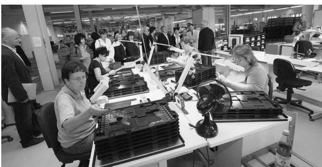
Gütekontrolle bei der Zimk GmbH. 260 Beschäftigte arbeiten für das Unternehmen.

WIRTSCHAFT Exin-Oberschule und Unternehmen schließen Kooperationsvertrag