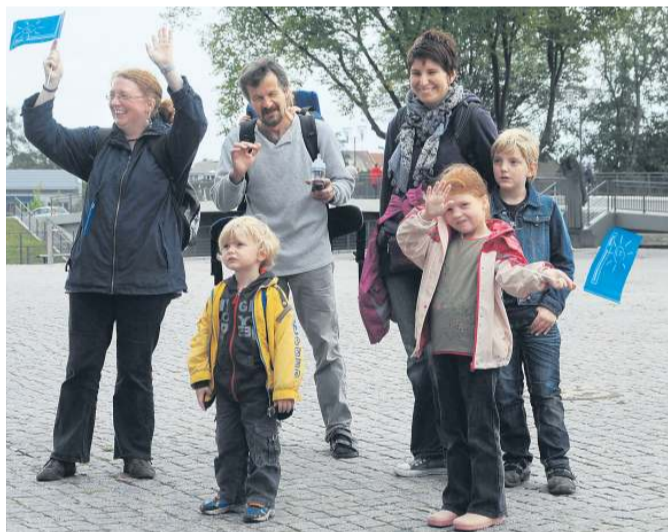
Rund 20 Zuschauer kamen zufällig am Schloss vorbei.

so ein mobiles Konzert ruhig häufiger stattfinden könnte. „Ein Mal im Monat wäre das gut“, sagt die Zehnjährige. Mal sehen, vielleicht wird die Rekordtour ja wiederholt, jetzt ist erstmal ganz schnell